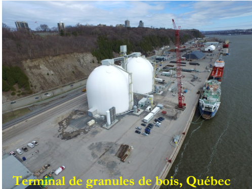
Terminal de granules de bois, Québec