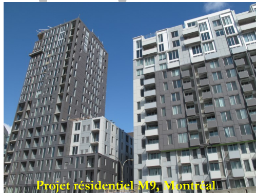
Projet résidentiel M9, Montréal