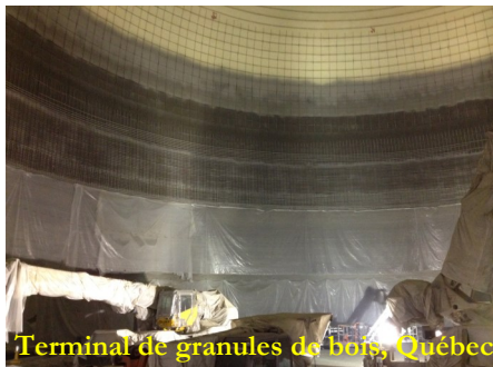
Terminal de granules de bois, Québec