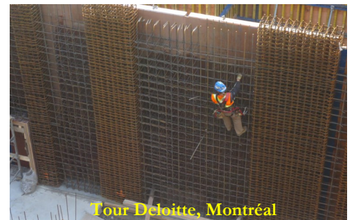
Tour Deloitte, Montréal

Un MERCI tout spécial à tous ceux qui ont collaboré au succès de ces projets !!!