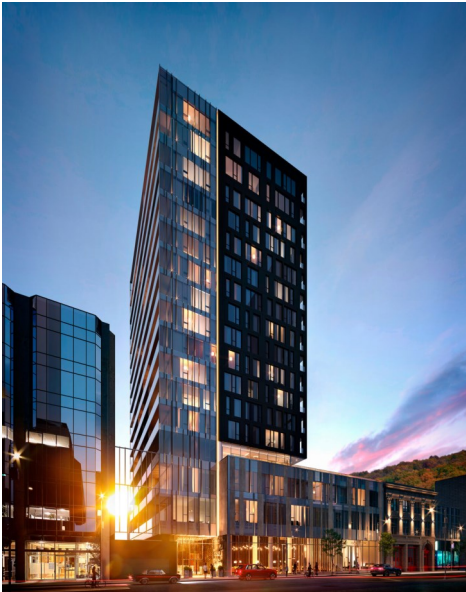
Le Gatsby, Montréal, 500 TM