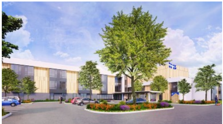
SQL Maison des aînées et alternatives, Carignan, 550 TM