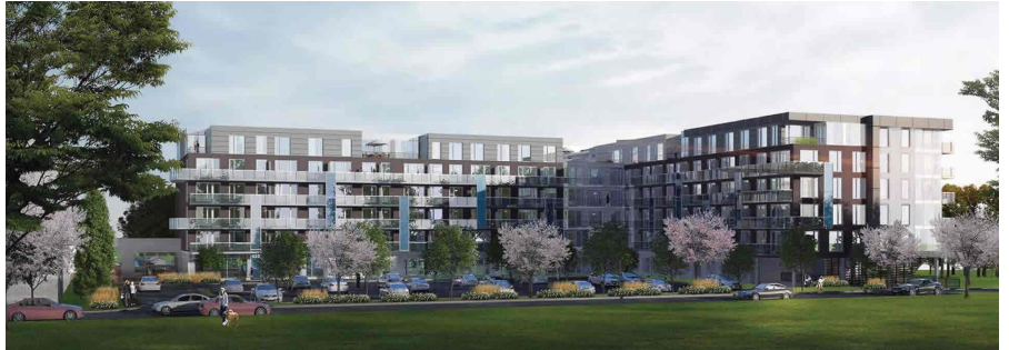
Evol phase 2, St-Jean-sur-Richelieu, 600 TM