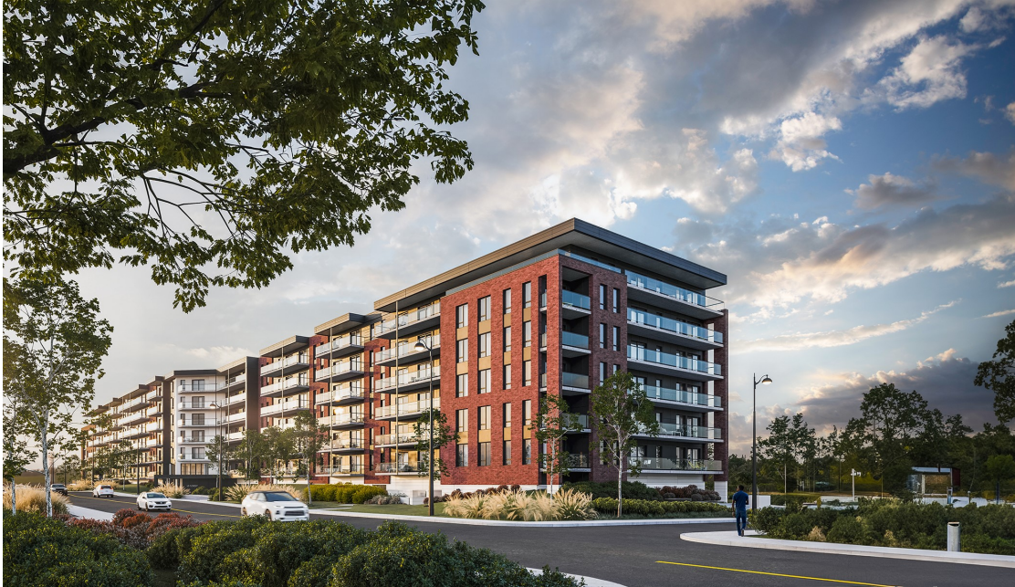
Le Florent, Trois-Rivières, 1 200 TM