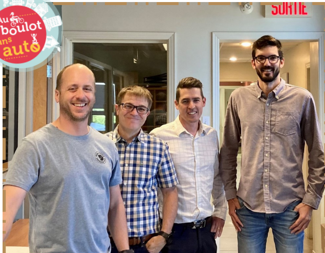
* Alexandre Nadeau est absent sur la photo *

5 de nos légendes ont décidé de relever le défi lancé par la Ville de Victoria-ville, soit de parcourir la plus grande distance en transport actif (vélo, marche, course, etc.) lors des allers-retours au travail. Ils ont donc jusqu'au 22 septembre prochain pour cumuler des km.