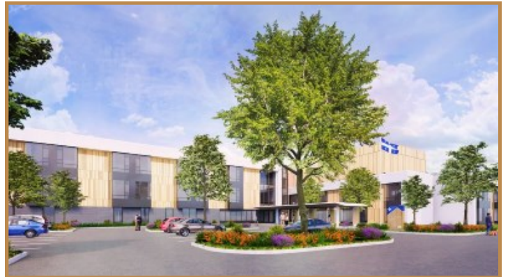
Maison des aînés et alternatives, Carignan, 575 TM