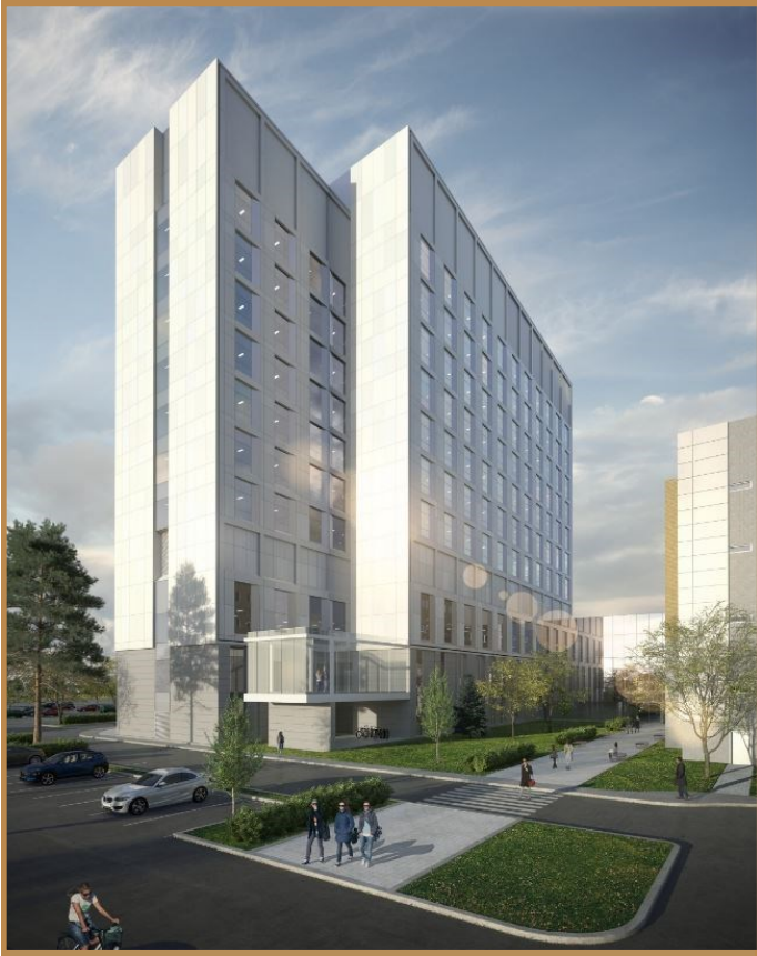
SQI Hôpital Pierre-Le Gardeur, Terrebonne, 2 500 TM