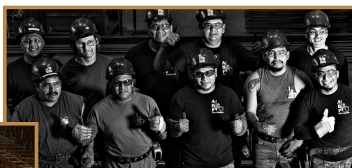
L'équipe de production

Nous avons perfectionné nos méthodes, nos intégrations de ceux-ci et nos travailleurs québécois ont été très aidants dans ce processus en accueillant les « Quats » comme de l'aide et maintenant, comme des collègues, des amis, DES LÉGENDES / LEYENDAS à part entière!