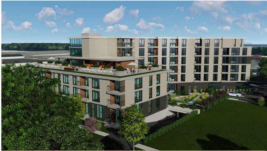
Le Racine, Vaudreuil-Dorion, 300 TM