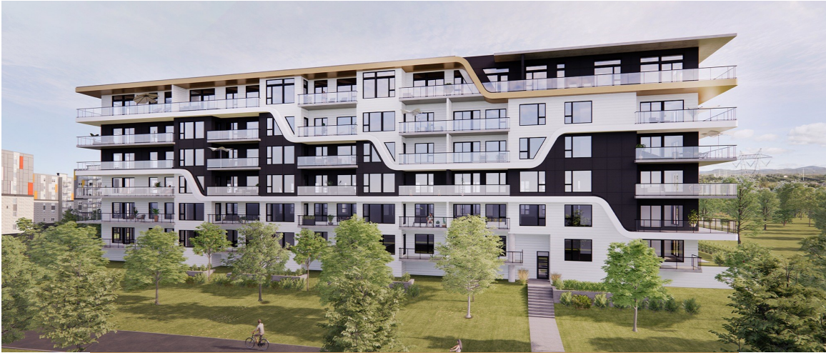
Ariela, Québec, 1 000 TM