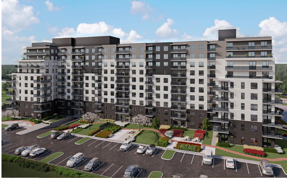
Exal Léo Lacombe, Laval - 1 000 TM